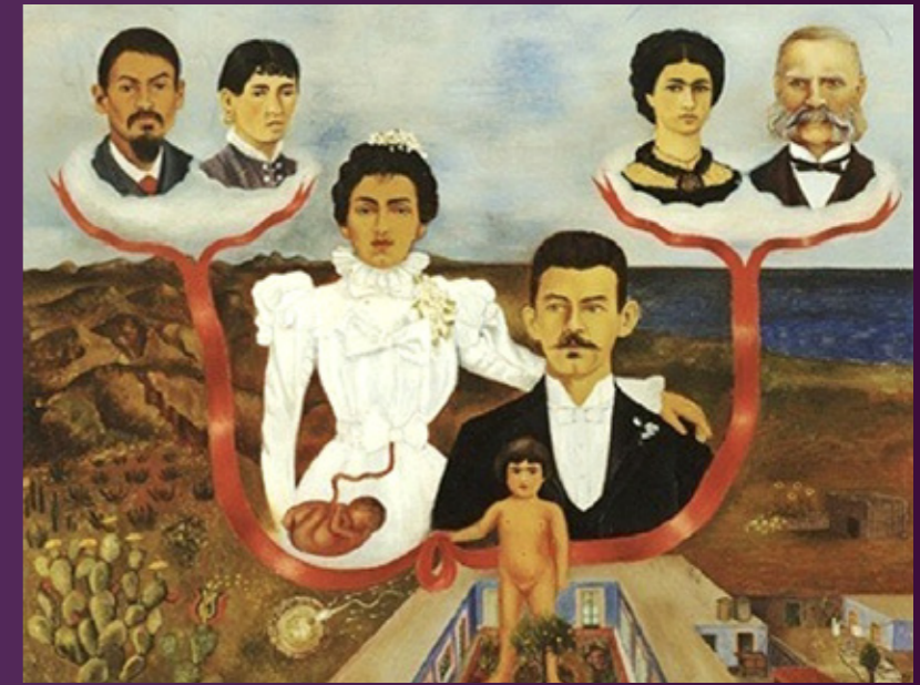
MIS ABUELOS, MIS PADRES Y YO (MES GRANDS-PARENTS, MES PARENTS ET MOI) huile sur toile, 1936 MIS ABUELOS, MIS PADRES Y YO (MY GRANDPARENTS, MY PARENTS AND ME) oil on canvas, 1936