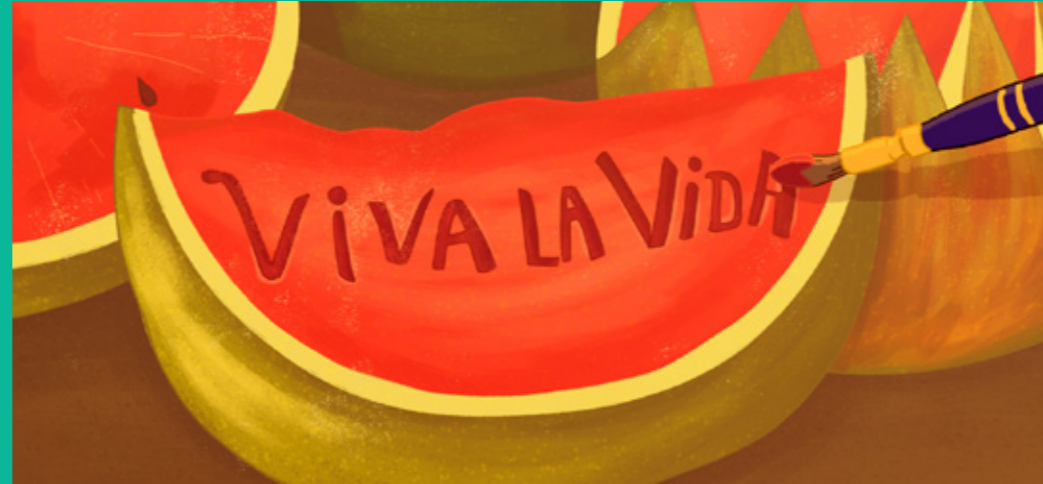
VIVA LA VIDA (VIVE LA VIE) huile sur toile, 1954 VIVA LA VIDA (LIVE LIFE) oil on canvas, 1954