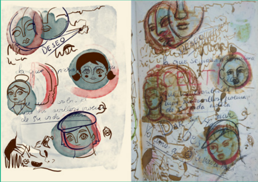
Carnet de dessins, Technique mixte Notebook of drawings, Mixed media