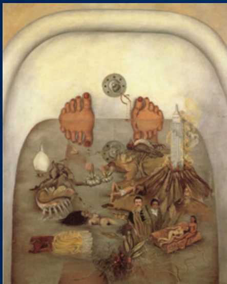
LO QUE EL AGUA ME DIO (CE QUE L'EAU M'A DONNÉ) huile sur toile, 1938 LO QUE EL AGUA ME DIO (WHAT WATER GIVEN ME) oil on canvas, 1938