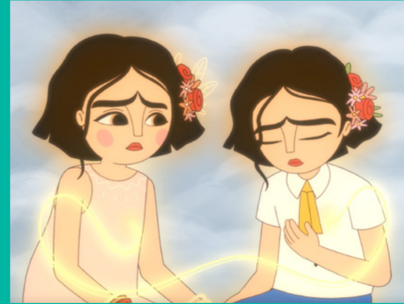
LOS DOS FRIDAS (LES DEUX FRIDA) huile sur toile, 1939 LOS DOS FRIDAS (THE TWO FRIDA) oil on canvas, 1939