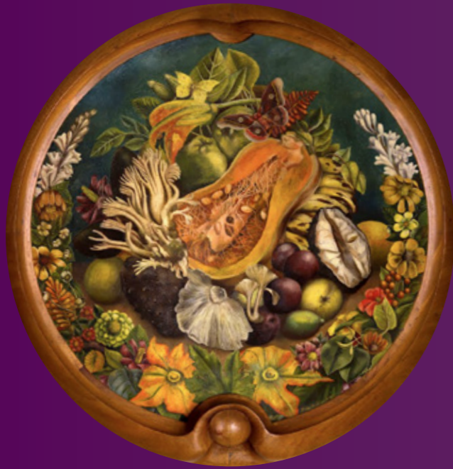
BODEGÓN (NATURE MORTE) huile sur toile, 1942 BODEGÓN (DEAD NATURE) oil on canvas, 1942